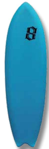
Board 5'10" / WP : 52 cm / épaisseur : 6 cm