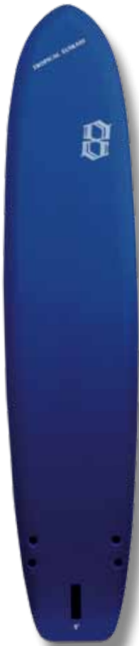
Board 9' fat / WP : 58,5 cm / épaisseur : 8 cm

Facile d'accès, cet emplacement stratégique permet un rapport direct avec le shaper et un suivi sérieux.