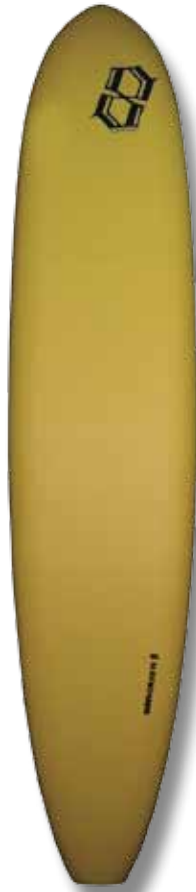
Board 9' / WP : 58,5 cm / épaisseur : 8 cm