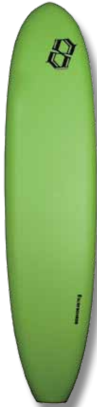
Board 8' / WP : 56,5 cm / épaisseur : 8 cm