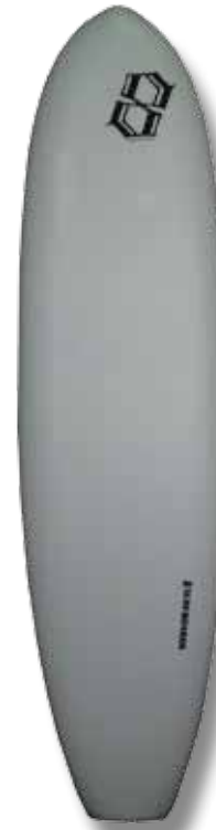
Board 7' / WP : 54,5 cm / épaisseur : 8 cm