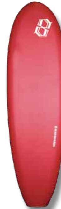
Board 6' / WP : 52 cm / épaisseur : 6 cm